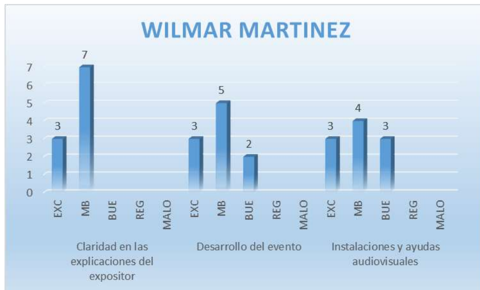
Gráfica No. 1 Calificación Total – WILMAR MARTINEZ