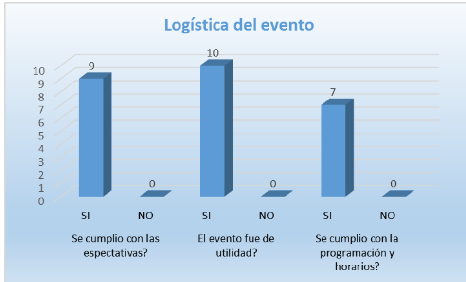
Gráfica No. 4 Calificación Total del Evento: "LOGISTICA DEL EVENTO"